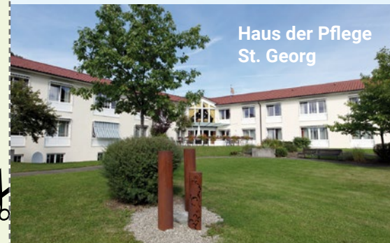
Haus der Pflege St. Georg