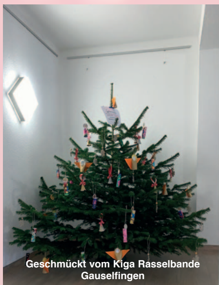
Geschmückt vom Kiga Rasselbande Gauselfingen