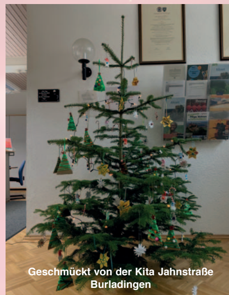
Geschmückt von der Kita Jahnstraße Burladingen

Wir danken den Einrichtungen ganz herzlich für ihr Engagement und erfreuen uns nun an den schönen Bäumen - schauen Sie doch einfach mal rein!