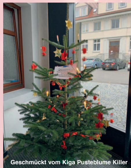
Geschmückt vom Kiga Pustelblume Killer

Übersicht unserer Weihnachtsmärkte auf Seite 3!