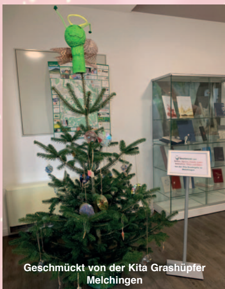
Geschmückt von der Kita Grashüpfer Melchingen